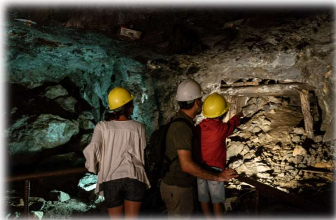
Miniera del Temperino