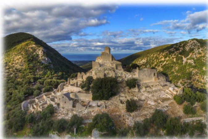
Rocca San Silvestro